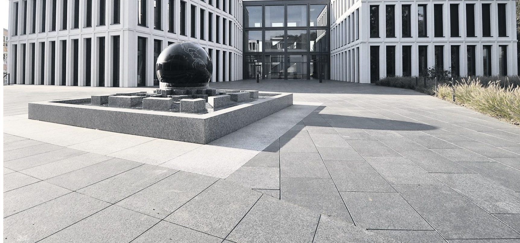
Auf den CEDAR CAMPUS in der Eisleber Straße in Weinheim ist ein dreistöckiger Neubau entstanden, in dem die Firmen Atral Secal und GIS ihre Büros bereits bezogen haben.

Dass sich die Verantwortlichen des CEDAR CAMPUS mit Weinheim eng verbunden fühlen, wird schon beim Firmennamen CEDAR (englischer Begriff für Zeder) deutlich. Denn damit nehmen die Inhaber