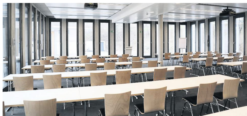
Der große Tagungsraum bietet auf 238 Quadratmetern Platz für bis zu 170 Personen.