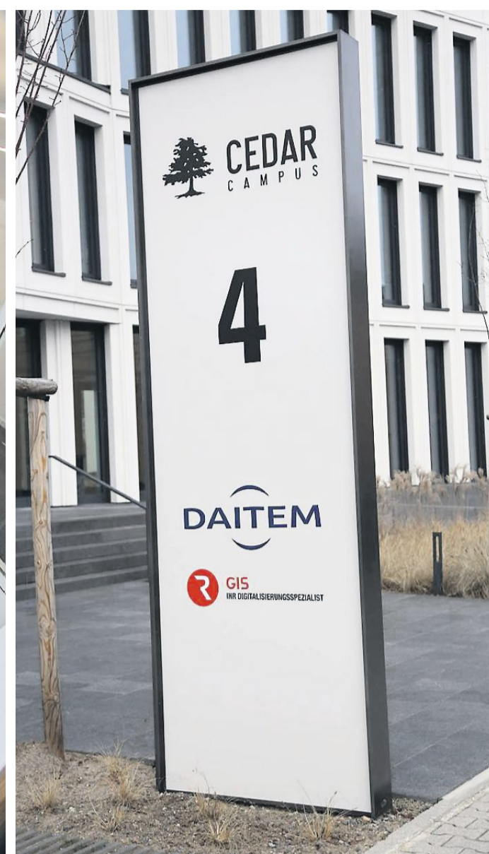
GIS und Atral mit der Marke DAITEM haben ihre Büros auf dem CEDAR CAMPUS.