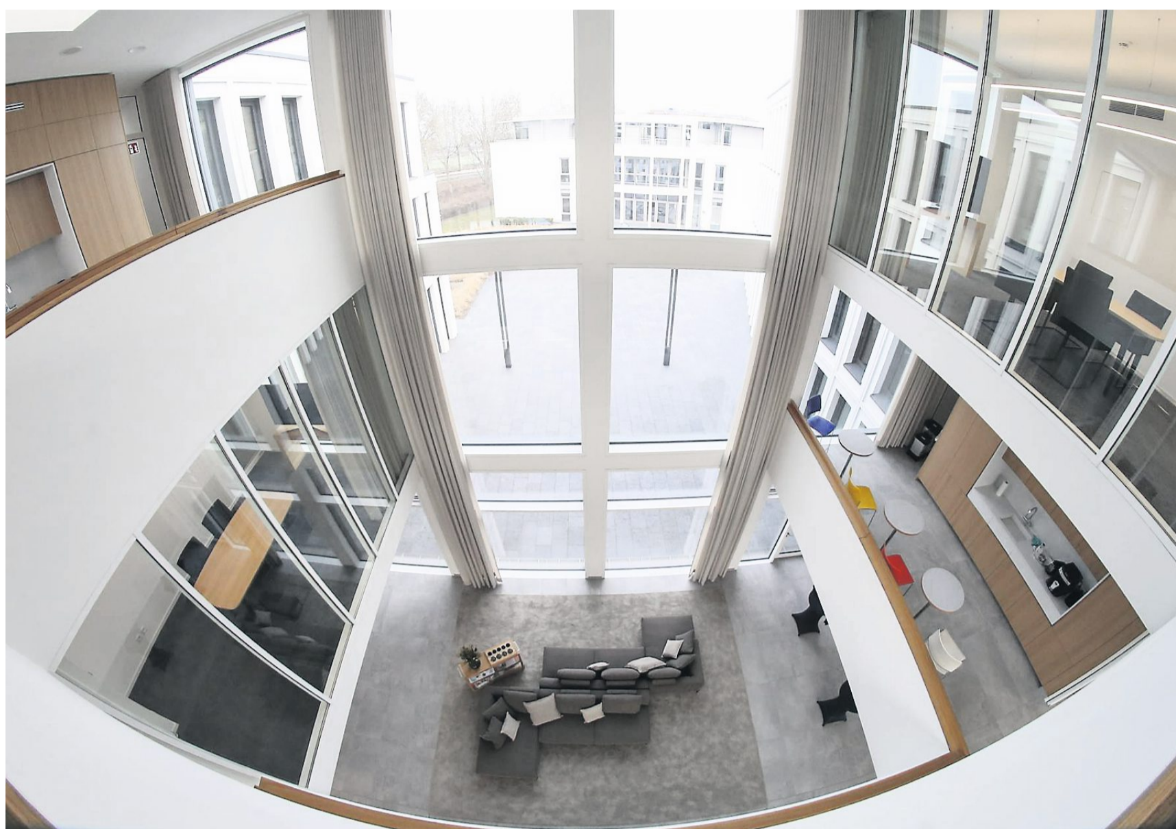
Das „Mitrium“ ist das Herzstück des neuen Bürogebäudes, das die Firma CEDAR in der Eisleber Straße in Weinheim errichtet hat.

CEDAR GmbH & Co. KG errichtet Bürokomplex in der Eisleber Straße 4 in Weinheim